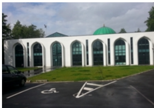
© Des dômes et des minarets