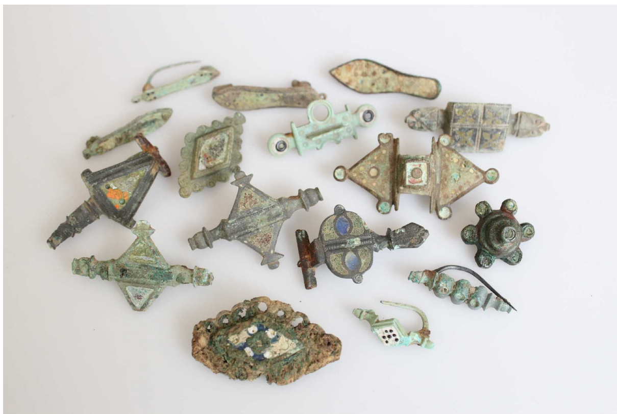
Ensemble de fibules émaillées provenant de Famars (Nord) cliché : A. Tixador (service archéologique de Valenciennes)

Journées organisées par le Ministère de la Culture et de la Communication, DRAC Nord-Pas-de-Calais - Service Régional de l'Archéologie en collaboration avec l'Université de Valenciennes et du Hainaut-Cambrésis Laboratoire Calhiste (Culture, Arts, Littératures, Histoire, Imaginaires, Sociétés, Territoires, Environnement).