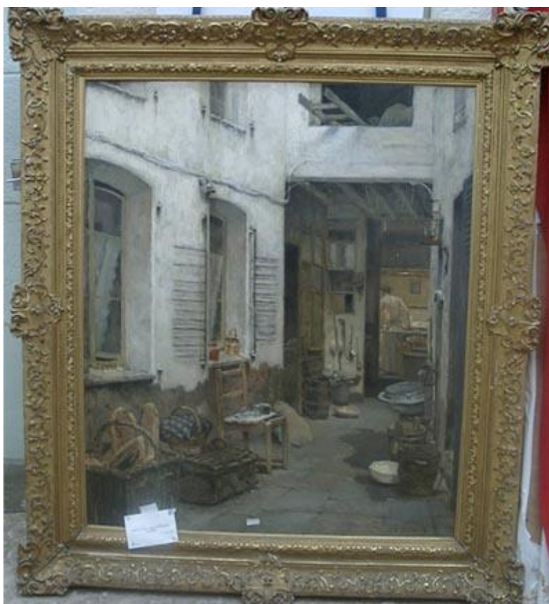
Jean-Charles Cazin, La boulangerie Coquelin.

Visite libre du musée Jean-Charles Cazin.