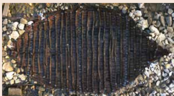
▲ Aude (11), Mandirac / Épave bateau - Épave de l'antiquité tardive utilisée pour la construction de l'ancienne embouchure du fleuve - photo ©C. Sanchez, CNRS.

Ce pôle met en œuvre la politique en matière de connaissance, de protection, de conservation, de restauration et de diffusion des patrimoines (monuments historiques, biens inscrits sur la liste du patrimoine mondial, architecture, espaces protégés, archéologie, ethnologie, musées, archives). Il assure des missions de conseil, de contrôle scientifique et technique, et de suivi des travaux. Une mission est également exercée au sein de chaque département pour promouvoir la qualité architecturale et urbaine, pour préserver et mettre en valeur les espaces protégés et valoriser le patrimoine des territoires (UDAP). Par sa politique de diffusion (publication Duo, bulletin scientifique régional...) ce pôle restitue au public la connaissance autour des patrimoines et de soutien à l'architecture.