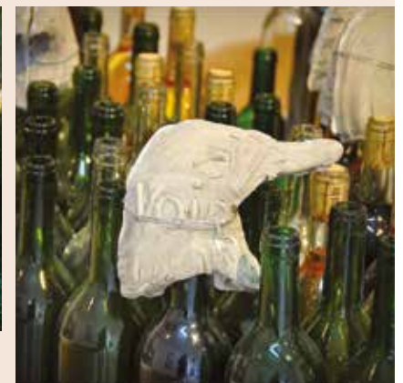
Tarn (81), Gaillac / Carmelo Zagari, artiste avec les vignerons de Gaillac - photo ©Jean-François Peiré.