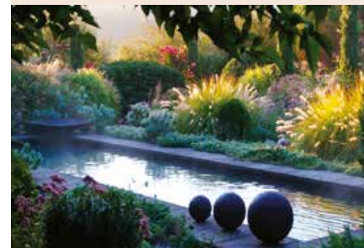
Hautes-Pyrénées (65), Thermes-Magnoac / Jardin de la poterie Hillen - photo ©Jardin de la poterie Hillen.