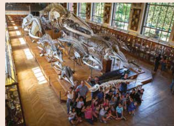
▲ Aude (11) / Les Labos de la baleine - Prix de l'audace artistique et culturelle photo ©Sylvère Petit.