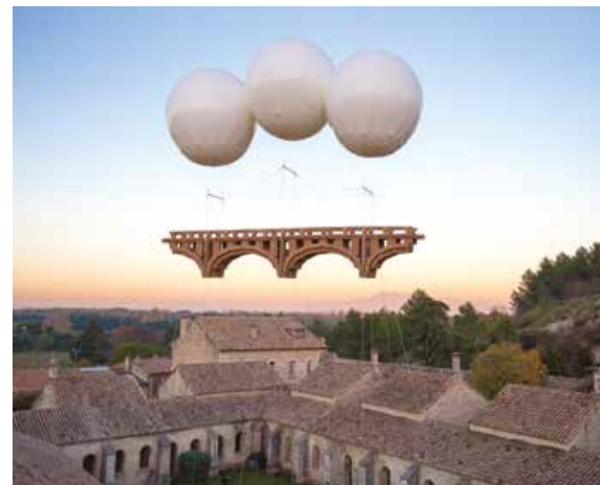
Gard (30), Villeneuve lez Avignon / Architecture en fête 2015 - photo ©Alex Nollet.