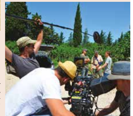
Gard (30), Aramon / Toril , long métrage de Laurent Teyssier tourné en mai 2015 - photo ©Marin Rosenstiehl, Languedoc-Roussillon Cinéma.