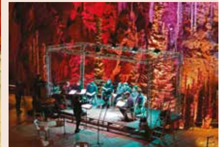
Lozère (48), grotte Aven Armand, concert de l'ensemble Fortuna Orchestra, septembre 2017.