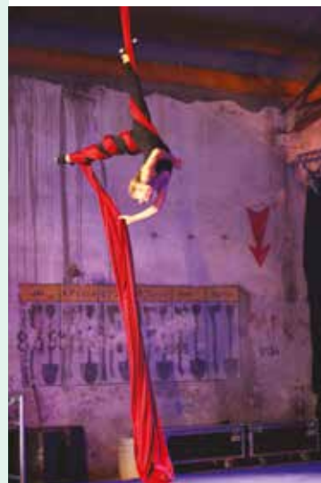
Gers (32), Auch / CIRCa - photo ©CIRCa.

Ces pôles permettent de répondre de manière la plus précise et la plus adaptée qu'il soit aux différentes missions et de répartir les champs d'action et les compétences de chacun dans les divers axes d'intervention.