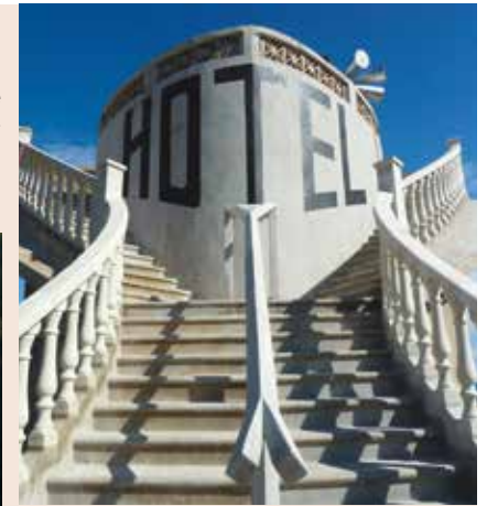
Pyrénées-Orientales (66), Cerbère / Hôtel le Belvédère - photo ©Michèle François.