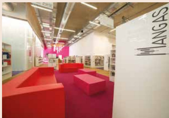
▲ Aveyron (12), Millau / Médiathèque du sud-Aveyron (MESA) - photo ©Aurelien Trompeau. Atelier vidéo photo.