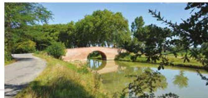
Occitanie / Le canal du Midi photo ©Jean-François Peiré.