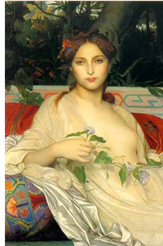
Hérault (34), Montpellier / Albayde , Alexandre Cabanel, 1848 huile sur toile 98 x 80,5 cm, Musée Fabre inv 868.1.7 - Don Alfred Bruyas, 1868 - photo ©Musée Fabre.