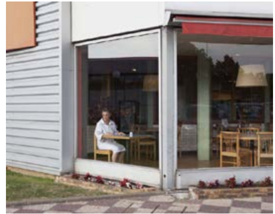
Marion Gambin France (s) territoire liquide Série « Entre deux lieux » Aire d'autoroute, France, 2013 © Marion Gambin, Bourse de la Fondation de France, Highway Television, Sanef Courtesy label Expositions - Delphine Charon, Paris