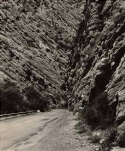
Sophie Ristelhueber Mission photographique de la DATAR Série « Ouvrages d'art et paysage en montagnes » N 202, entre Barrême et Dignes (Alpes-de-Haute-Provence) Environs de Saint-Clément (Hautes-Alpes), 1986 Sophie Ristelhueber © ADAGP, Paris 2017 BnF, Estampes et photographie