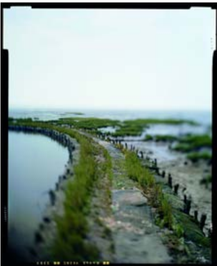
Mission photographique du Conservatoire du littoral Série « Delta de la Leyre », 2006-2007