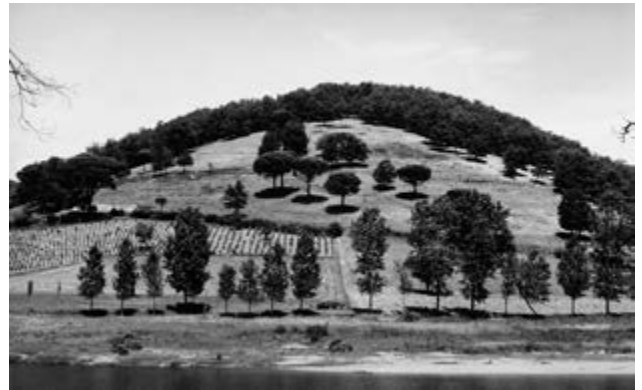
Pierre de Fenoÿl Mission photographique de la DATAR Série « Campagnes du Sud-Ouest » 10/07/87, 14 h, Tarn, 1987