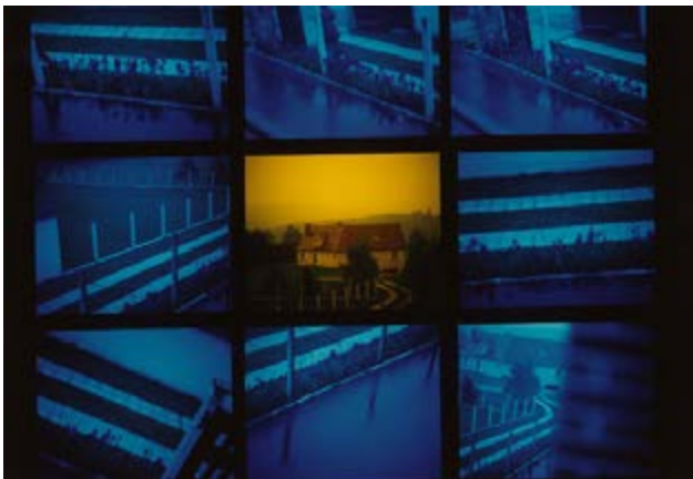
Tom Drahos Mission photographique de la DATAR Série « Banlieue parisienne, les espaces périurbains de la région parisienne » Chevreuse (Seine-et-Oise), 1986