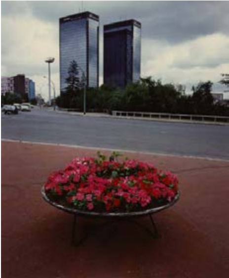
Robert Doisneau Mission photographique de la DATAR Série « Banlieue d'aujourd'hui, dans les banlieues et villes nouvelles de la région parisienne » Tours Mercuriales, Porte de Bagnolet, Bagnolet (Seine-Saint-Denis), 1984

Les œuvres de l'ADAGP ( www.adagp.fr ) peuvent être publiées aux conditions suivantes : • Exonération des deux premières œuvres illustrant un article consacré à l'exposition de la BnF en rapport direct avec celle-ci et d'un format maximum d'1/4 de page • Au-delà de ce nombre ou de ce format les reproductions seront soumises à des droits de reproduction/représentation • Toute reproduction en couverture ou à la une devra faire l'objet d'une demande d'autorisation auprès du Service Presse de l'ADAGP.