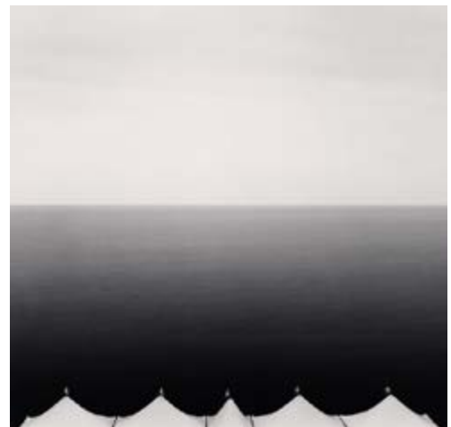
Michael Kenna Mission photographique du Conservatoire du littoral Série « L'Archipel de Chausey » 2007-2008 Five Canopies, Chausey Islands, France, 2007