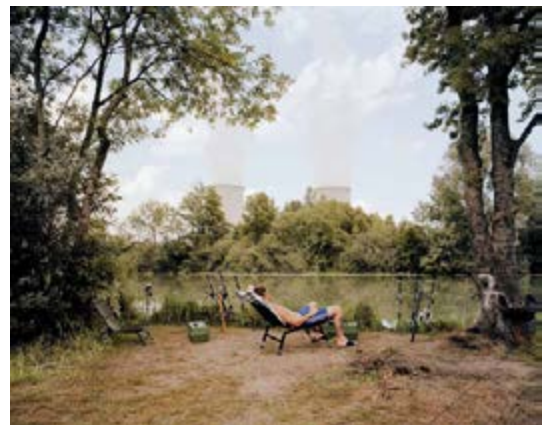
Jürgen Nefzger Série « Fluffy Clouds » Centrale nucléaire de Nogent sur Seine (Aube) , 2003, © Jürgen Nefzger, Courtesy Galerie Française Paviot, Paris BnF, Estampes et photographie