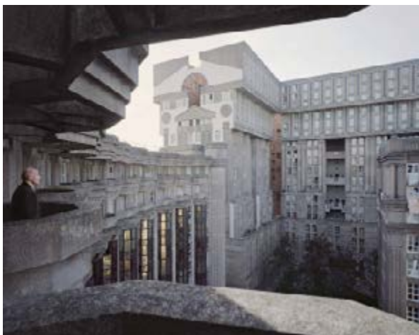
Laurent Kronental Série « Souvenir d'un Futur » Joseph, 88 ans, Les Espaces d'Abraxas, Noisy-le-Grand, 2014