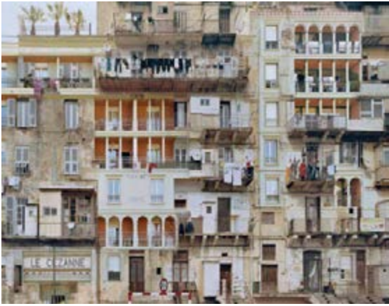
Stéphane Couturier Mission photographique du Centre méditerranéen de la photographie, commande « Sédimentations » Série « Melting Point », Bastia n°1 , 2007 Centre méditerranéen de la photographie, Bastia