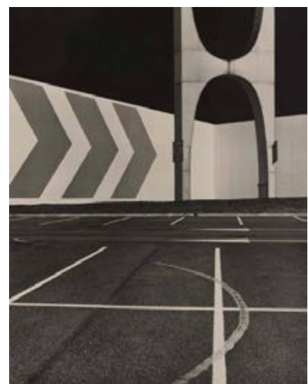
Albert Giordan Mission photographique de la DATAR Série « Espaces commerciaux », Montage photographique, 1984 © Albert Giordan BnF, Estampes et photographie