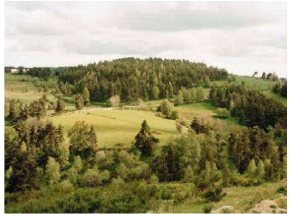
Thibaut Cuisset Série « Une campagne française » Sans titre (La Margeride, Lozère), 2010 Galerie Les Filles du Calvaire, Paris