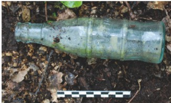
Bouteille de soda «Vérigoud»