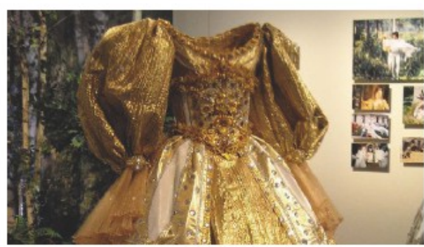
Robe couleur soleil (Pièce prêtée par la Cinémathèque)