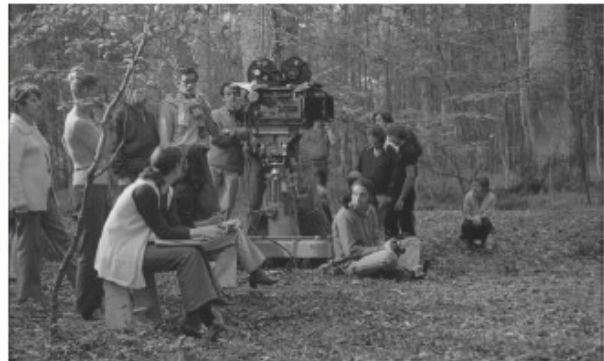
Tirage d'une photo du making-of