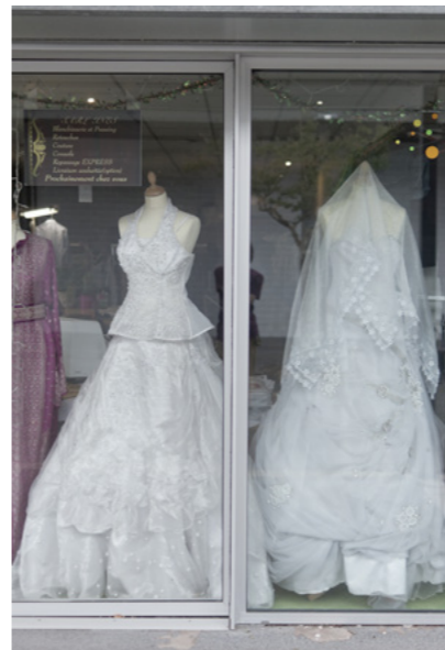
Vitrine voisine, galerie marchande du Grand Parc