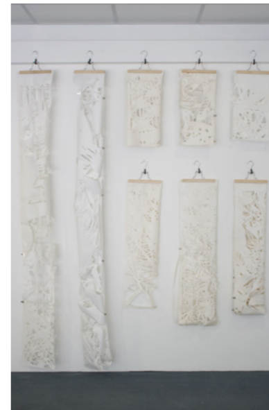
Vue d'exposition Galerie Ephémère, septembre 2014