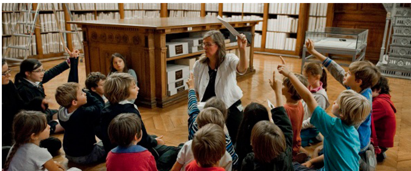
Visite des dépôts - © Archives nationales

Mercredi 25 mai 2016 (9h - 17h30) – Archives nationales, Site de Pierrefitte-sur-Seine