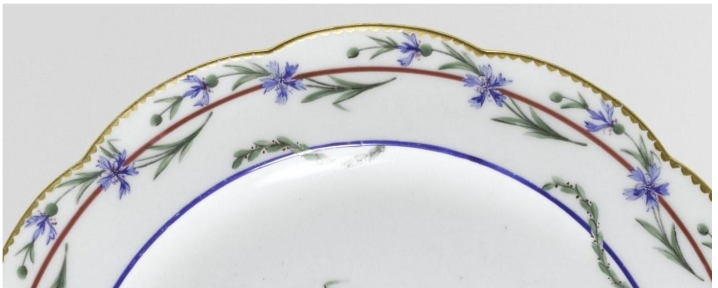
Différents détails du marly de l'assiette du Service du Gobelet du Roi Louis XVI