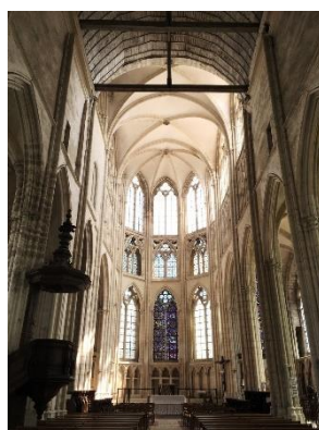
Église St-Sulpice à St-Sulpice de Favières