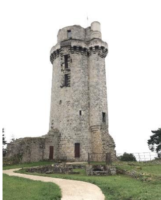
La tour Montlhéry

01 69 91 95 10 - udap.91@culture.gouv.fr