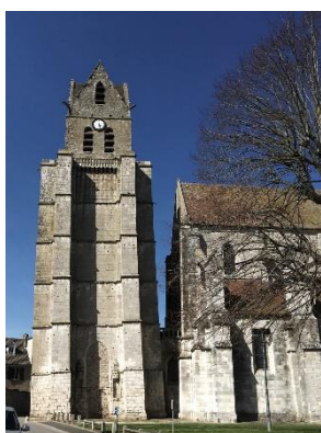
Église Saint-Martin à Étampes