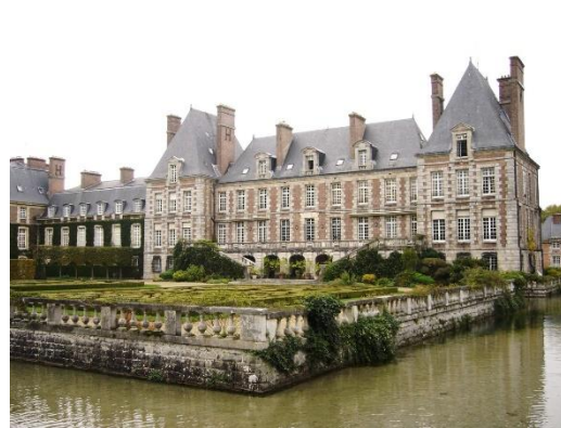
Château de Courances