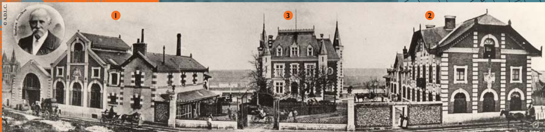
Classique des constructions industrielles des années 1860, l'alliance de la brique et de la pierre influence l'ensemble de l'usine de la Vilette.