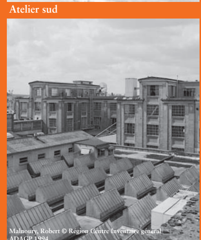
Malnouy, Robert © Région Centre Inventaire général - ADAGP 1994