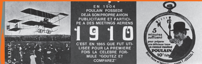
301 BLOIS - Chocolaterie Poulain - La Serré - LL