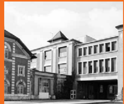
Hermanowicz, Mariusz © Région Centre Inventaire général - ADAGP 1994