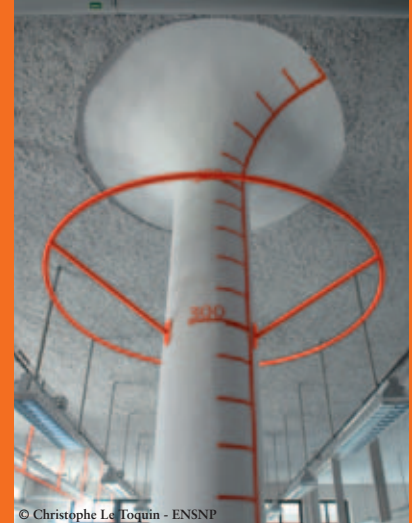
Colonne à évasement de l'atelier nord