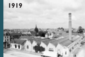
Malnouy, Robert © Région Centre Inventaire général - ADAGP 1994