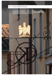
18 les dispositifs techniques

Chaque intervention sur les façades de nos centres anciens et urbains compte et participe à l'harmonie du paysage urbain. Au cœur de nos villes et villages, l'intérêt particulier et l'intérêt général doivent être conjugués pour créer le cadre de vie que nous y recherchons tous.