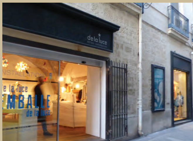
DEVANTURE CONTEMPORAINE EN FEUILLURE AVEC GRILLE EN APPLIQUE

C'est sans doute au XVII e siècle qu'apparaît la devanture vitrée dans un châssis de petit bois posé en feuillure dans l'épaisseur du mur ; elle est fermée par des panneaux amovibles en bois.