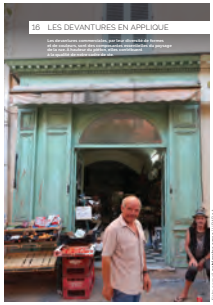
16 les devantures en applique