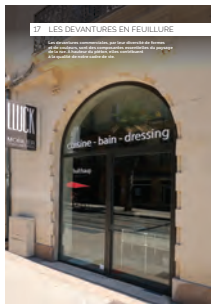
17 les devantures en feuillure