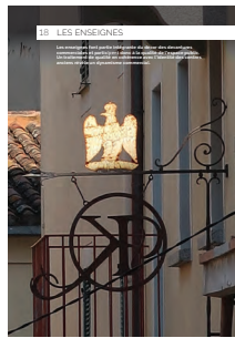
18 les enseignes

Chaque intervention sur les façades de nos centres anciens et urbains compte et participe à l'harmonie du paysage urbain. Au cœur de nos villes et villages, l'intérêt particulier et l'intérêt général doivent être conjugués pour créer le cadre de vie que nous y recherchons tous.