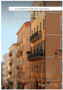
01 la composition des façades