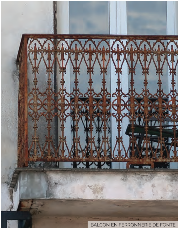
BALCON EN FERRONNERIE DE FONTE