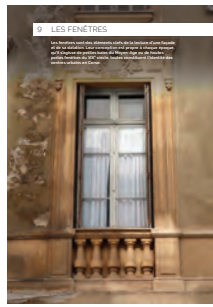
09 les fenêtres