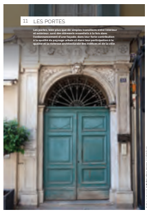
11 les portes

Chaque intervention sur les façades de nos centres anciens et urbains compte et participe à l'harmonie du paysage urbain. Au cœur de nos villes et villages, l'intérêt particulier et l'intérêt général doivent être conjugués pour créer le cadre de vie que nous y recherchons tous.