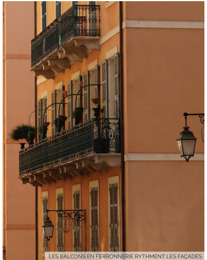
LES BALCONS EN FERRONNERIE RYTHMENT LES FAÇADES