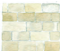
Appareillage régulier en pierre de taille, montées à sec ou à joints fins.