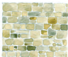
Appareillage régulier en moellons équarris, montés au mortier de chaux.

Dans les autres cas d'appareillage des pierres de taille de grand appareil, les murs sont montés à sec, sans mortier.