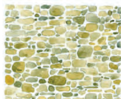
Appareillage de moellons de toute tailles non assisés, équarris ou non et montés au mortier de chaux et sable.

Maçonneries destinées à être enduites: moellons équarris sur une seule face en parement et non assisés. Certains murs pourront être rejointoyés, mais uniquement pour des ouvrages d'architecture rurale ne nécessitant pas une étanchéité parfaite (murets de clôture ou de grange, bâtiments secondaires)