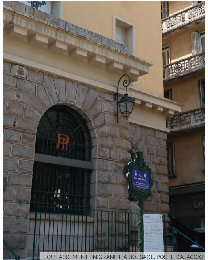
SOUBASSEMENT EN GRANITE À BOSSAGE, POSTE D'AJACCIO