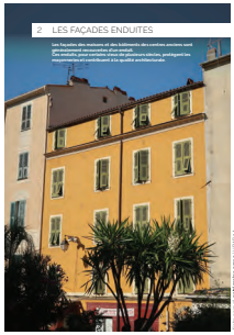
02 les façades enduites