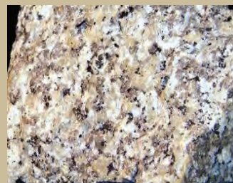
Variété des granites de la Corse du sud