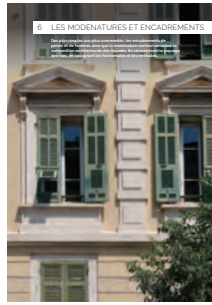
06 les modénatures et encadrements

Chaque intervention sur les façades de nos centres anciens et urbains compte et participe à l'harmonie du paysage urbain. Au cœur de nos villes et villages, l'intérêt particulier et l'intérêt général doivent être conjugués pour créer le cadre de vie que nous y recherchons tous.