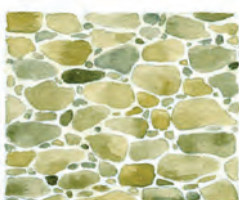
Appareillage de gros et petits moellons non assisés, non équarris et montés au mortier de chaux et sable.