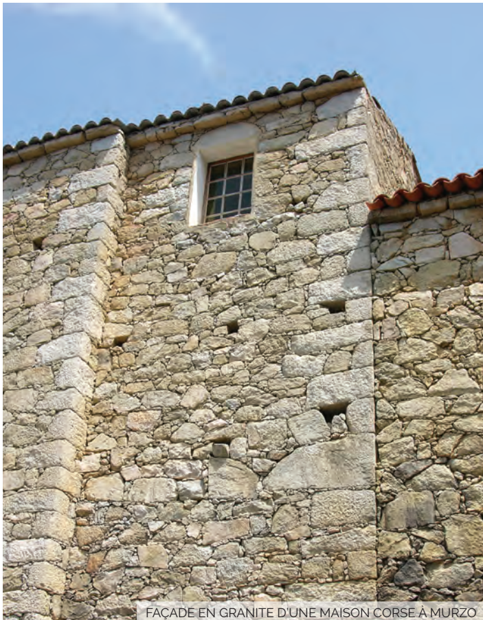
FAÇADE EN GRANITE D'UNE MAISON CORSE À MURZO